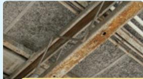
鋼材の形状が複雑でさびを完全に除去できない部位